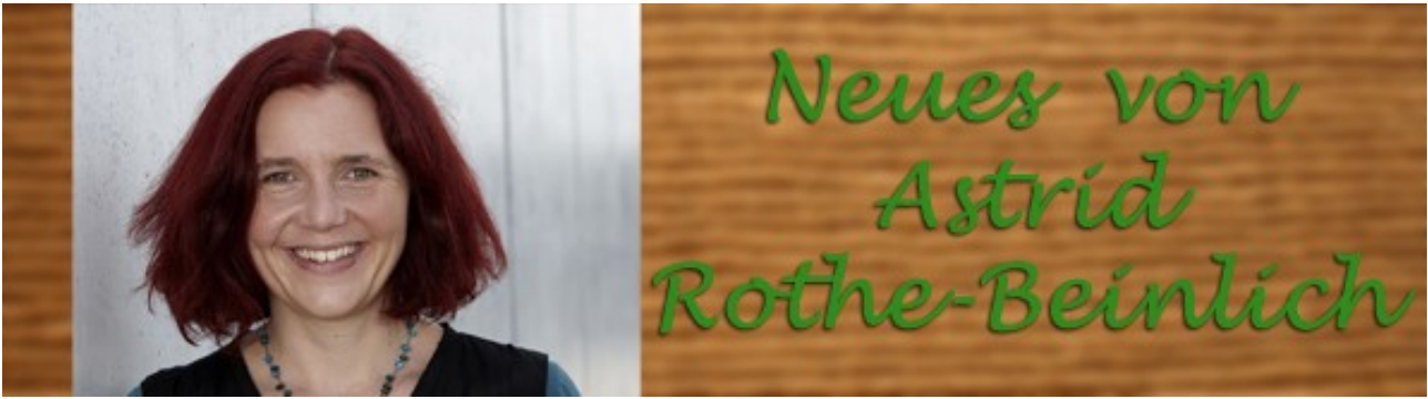
BÜNDNIS 90/DIE GRÜNEN Mitglied des Thüringer Landtags, Parlamentarische Geschäftsführerin